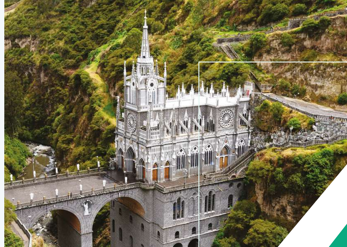
Santuario de Nuestra Señora del Rosario de Las Lajas, Nariño